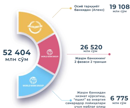
Жалб қилинадиган маблағлардан даромадлар