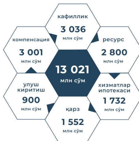
Фоизсиз шаклдаги даромадлар